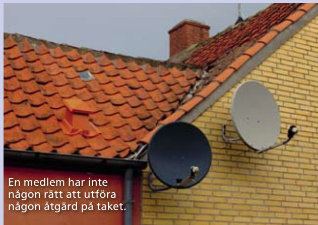
En medlem har inte någon rätt att utföra någon åtgärd på taket.

Svar: Ni ska underrätta eventuella panthavare om att hon inte betalar årsavgiften om det har uppstått mer än en månadsavgift i skuld. Gör det i rekommenderat brev. Om inte detta görs riskerar föreningen att förlora sin legala panträtt (innebär att föreningen får betalt för obetalda avgifter före alla andra om bostadsrätten sägs upp och säljs hos Kronofogden). Sedan är det en annan sak vad som är rättsligt motiverat. Ni bör upplysa henne om att det inte finns rätt att hålla inne avgiftsbetalning på grund av påstådda krav. Är man hyresgäst kan man deponera del av hyra